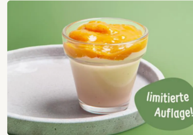
BIO Panna Cotta mit Pfirsich Röster