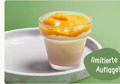
BIO Panna Cotta mit Pfirsich Röster