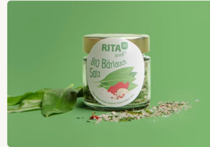
BIO Bärlauch Salz 90 g