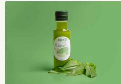
BIO Bärlauch Öl 110 g