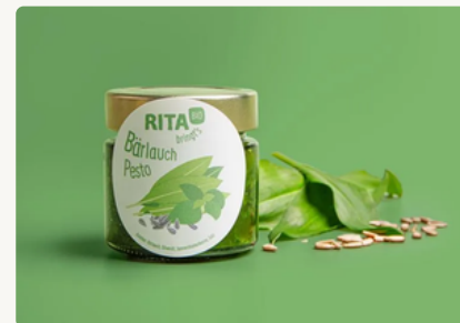
BIO Bärlauch Pesto 200 g