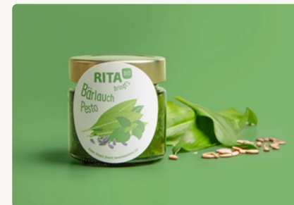
BIO Bärlauch Pesto 200 g