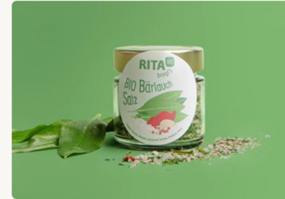
BIO Bärlauch Salz 90 g