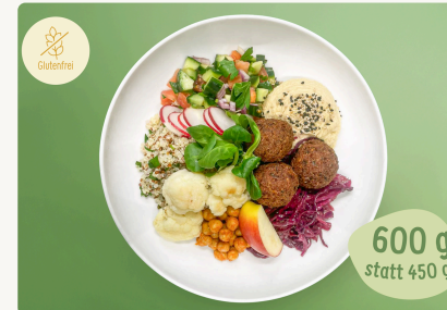
BIO Orient Bowl mit hausgemachten Falafeln und Hummus