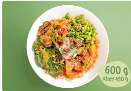
BIO Frühlingserwachen Bowl mit Bulgur, hausgemachtem Kimchi und salzigem Granola