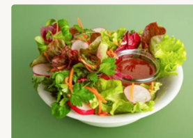
BIO Gemischter Salat mit Balsamico Dressing