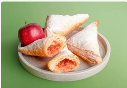
BIO Apfeltaschen 2 Stück