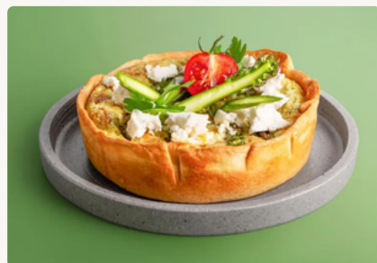
BIO Spargel Quiche mit Feta und Kräutern