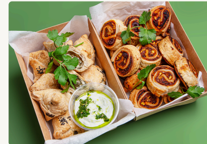
18 BIO Pizzaschnecken 9 BIO Spinat Feta Taschen

BIO Spinat Feta Taschen und Pizzaschnecken Box