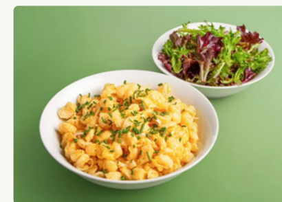
BIO Dinkel-Eiernockerl mit Blattsalat