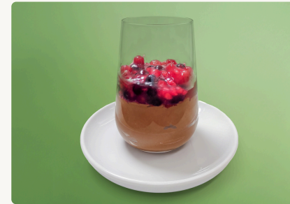
BIO Schoko Mousse mit Beerenröster