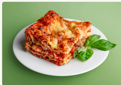
BIO Ratatouille Lasagne