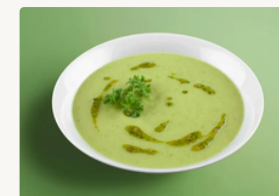
BIO Erbsencremesuppe mit Petersilöl