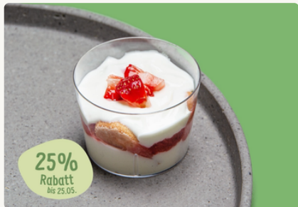
BIO Erdbeer Tiramisu